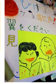
急ピッチで制作中!

今回は関谷院長も参加。年齢を感じさせない軽快な動きで順調に試合を進めるそんな院長に若さの秘訣を聞いてみた。「いや、最近目が老化してきてね。眼鏡などいとお手入れが欠かせないんだよ...やはり身体は年齢であるようだ。」