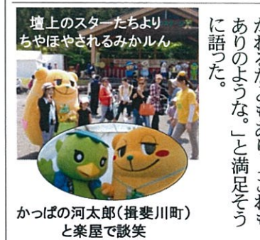
かつばの河太郎(攝斐川町)と楽屋で談笑