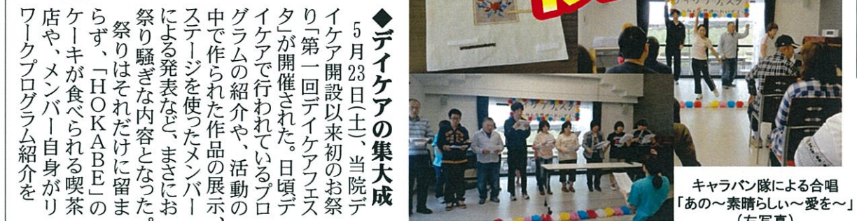
キャラバン隊による合唱「あの～素晴らしい～愛を～」(左写真)

卓球シリーズ2015 第6戦 ミナツキオープン 6月15日(月)デイケア 誰でも参加できます★