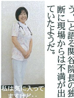
私は気に入ってますけど...