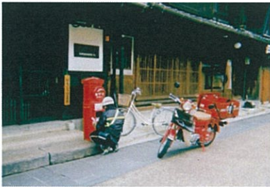
今月のベストショット 「川原町の一コマ」