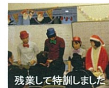
残業して特訓しました

キャラバン隊が 老人ホームを慰問 11月27日(金)デイクア音楽クラブのメンバーが、海津市の特別養護老人ホーム「松風苑」を訪れ、合唱やトーンチャイムで「上を向いて歩こう」「高校3年生」など全7曲を披露した。