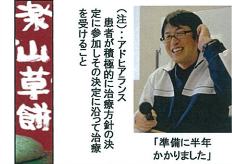
「準備に半年かかりました」

発行所 社会医療法人緑峰会 養南病院 〒503-0401 海津市南濃町津屋1508 ☎(0584)57-2511 Fax(0584)57-2513 http://www.yonan.or.jp @yonan@ogaki-tv.ne.jp