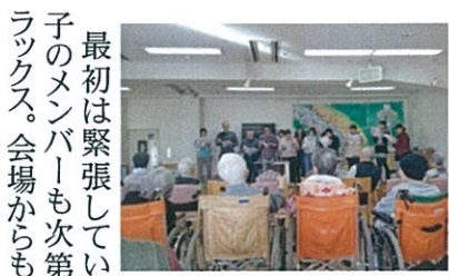
沸き起こるアンコールにまんざらでもないメンバー

卓球シリーズ 2015開幕! 錦織圭にあやかり、デイクアでも「卓球年間ランキング」がスタートする。毎月大会と、毎週(火)の昼休みに開催される定期戦でポイントを獲得し、ランキングが決定。中でも「全養オープン」「全悠オープン」「理事杯」「創立記念杯」の4大会は獲得ポイントが高く設定されている。そして12月には各大会の優勝者とランキング上位者でグランドチャンピオン大会が開催されること。初代デイクア卓球王者の栄冠は誰の手に。開幕戦は1月10日の「ニューイヤークップ」だ。