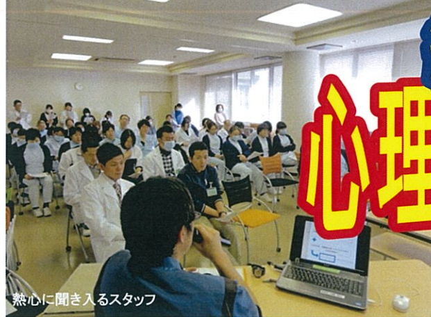
熱心に聞き入るスタッフ