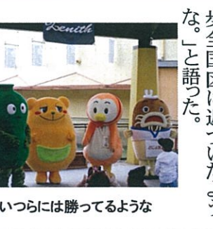
こいつらには勝つてのような