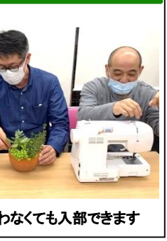
ミシンが似合わなくても入部できます

横井 ヨモギはね、冷え性便秘、アトピーなどに効果があるだけでなくデトックス効果もあって美容にも最適。ハーブの女王と言われるのよ。知らんけど。 ふーん。新商品ってほかにあるの? 横井 ラベンダー入りやヨモギ茶も開発予定よ。これも怪しいけど。 へー。それは楽しみです。期待せず待ってま。