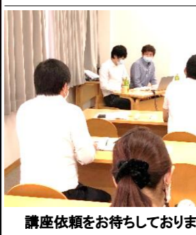
講座依頼をお待ちしております

オンラインデイケア大会 9月3日(土)、全国のデイケア施設がオンラインで一同に会し、ゲームなどをするイベントが開かれた。このイベントは静岡県、メンタルクリニック「ダダ」が企画したもので今年が第一回目。当院ももちろん参加。自慢の大スクリーンに画面を映し大会を楽しんだ。