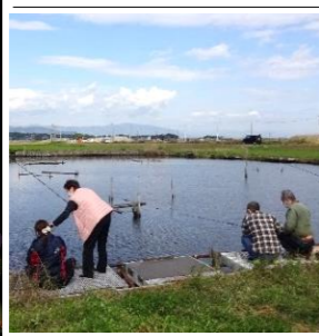
先生の言うとおりにやってただけだな～

ルンパミガールン 「この駐車場の一部らしきものは、私が一番描きこんだんだ」 「冷凍餃子が届き、これはこれで美味しいわね」 「この駐車場の一部らしきものは、私が一番描きこんだんだ」