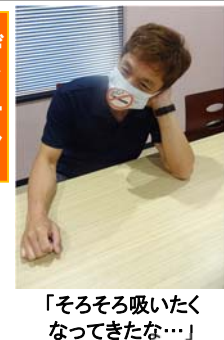
「そろそろ吸いたくなってきたな...」

デイケア 夏の風物詩である花火。夜にやってみると映えるというのでナイトケアプログラムとして行われた。清光彦作業療法士のチョイスした