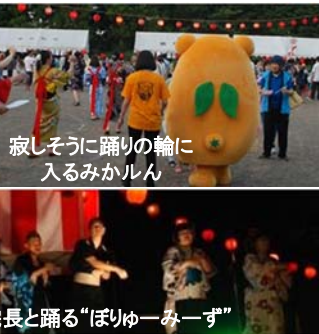
院長と踊る「ぼりゆ〜み〜ず」

「粉もんフェス」 おなじみ宮嶋委員長がぶった切るこのコーナー。今回はデイケア月一の人気企画「ちっそう緑峰」宮「さあ、今回は何?」丸「麵フェス、カレーフェスに次いで今回は粉もんフェスです」