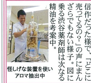
怪しげな装置を使いアロマ抽出中