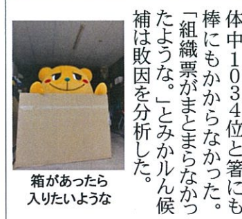
箱があつたら入りたいよな