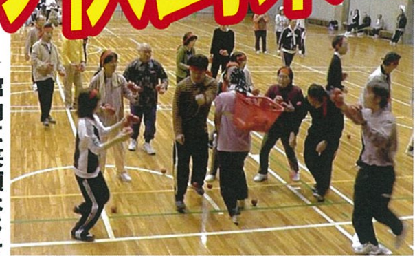
「玉入れ鬼ごっこ」では籠を担いだ職員もへとへとに

館内に笑顔はじける 10月21日(火)海津市南濃町体育館において「はつらつ養南合戦」の汗かき大会が開催され、入院患者、スタッフ合わせておよそ90人が参加した。大会は病棟対抗で行われ、リレー、綱引き、借り物競争、玉入れ鬼ごっこなどを楽しんだ。また日頃交流のない患者同士のフオークダンスもあり、恥じらいながらも手をとり合い上手にエスコートする姿も。