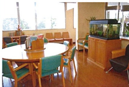
外来待合室 多いときには椅子が足りなくなることも

現在、曜日によっては5人の医師が午前中に同時に外来診療をしているため待合室が非常に混雑することが問題視されてきた。今回午後の外来診療時間を設けることでこれを解消しようという狙いだ。現在の金曜、日曜だけで