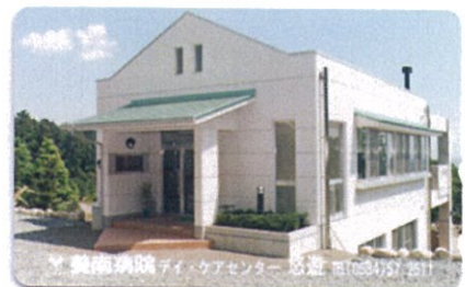
当時は何かと言えばテレホンカード

「タイムマシンに乗って」 「悠遊開設」平成7年、患者さんの早期社会復帰に向けてそれは建てられた。精神科デイケアとしては県内初だ。「悠遊」とは「豊かな自然の中で安らぎの心を」との趣旨で先代理事長が命名したとのこと。