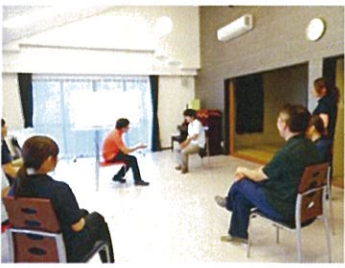
オレンジの似合う係長

「日本語で生活技能訓練のこと。職場での様々な場面での対処技能を獲得しようというプログラムです。」なるほど。具体的にはどのような?