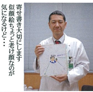
寄せ書き大切にします。似顔絵ちゃんと老け顔なのが気になるけど...

なつて良かった。」と院長が思わず感極まる一幕も。ちなみに歌合戦では、自信満々の院長が初の敗北を喫した。