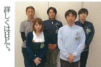
かしまるSMAP担当スタッフ

患者背景の傾向として、一般的な都市部のリワークプログラムと比べ、事務系同様に現業系も多いことが示された。また実績としては、現在までに62人が1か月以上の利用をしており、そのうち24人が現在利用中、27人が復職、就職した。復職(就職)率は71%であった。