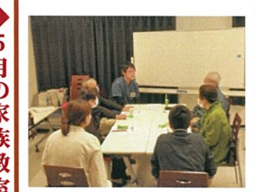
お互いの悩みを語り合う参加者

「慢性期のリハビリテーションに興味があります。」と語るなど頼もしい存在になりそうです。プライベートでは三人の子を持つ子煩悩なパパ。「趣味はカメラ。休日はもっぱら「古墳」を撮りに行ってます。」と語るが、家族サービスと称し、古墳に連れて行かれる子供たちの不満は高まっているという。