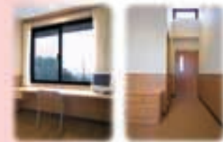
ストレスケアセンター 個室

入院に際しては何かとご心配のこととお察し致します。ご本人の早期社会復帰を目標に、明るく開放的な治療環境とより良い医療を提供できる様、スタッフ一同心がけています。