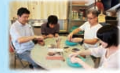
デイ・ナイトケアセンター「悠遊」