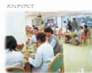
カフェテリアにて